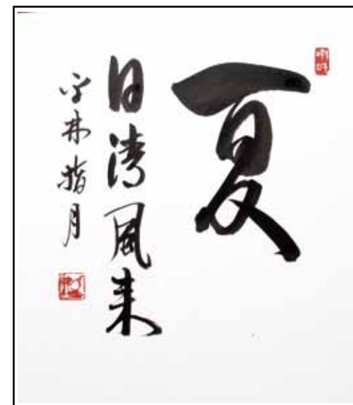
かじつせいふうきたる

松岩寺は昭和20年の戦災でほとんどの建物と仏具を焼失してしまいました。現在あるものはかろうじて焼け残ったものか、先々代と先代がそろえたものです。その中から、興味深い墨跡の一幅を機会をみつけて、紹介していきます。